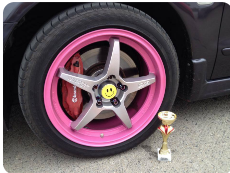
A legszebb felni

Férfiak és hölgyek külön mérték össze erejüket. A gyengébbik nemnek „mindössze” 7, a fiúknak 9 kg-os autó felnit kellett két kézzel vízszintesen minél tovább kitaniania. A zsűri nem volt túl szigorú, mivel több résztvevő is „bográcskitartó” verseny szellemében végezte mutatványát. Így tudtak plusz másodperceket, azaz jobb eredményt elérni. Mivel mindenki csak egyszer próbálkozhatott, ezért előnyt jelentett a minél későbbi indulás is. Egy alkalmi „szakkomentátor” megjegyzéseit a közönség derü-